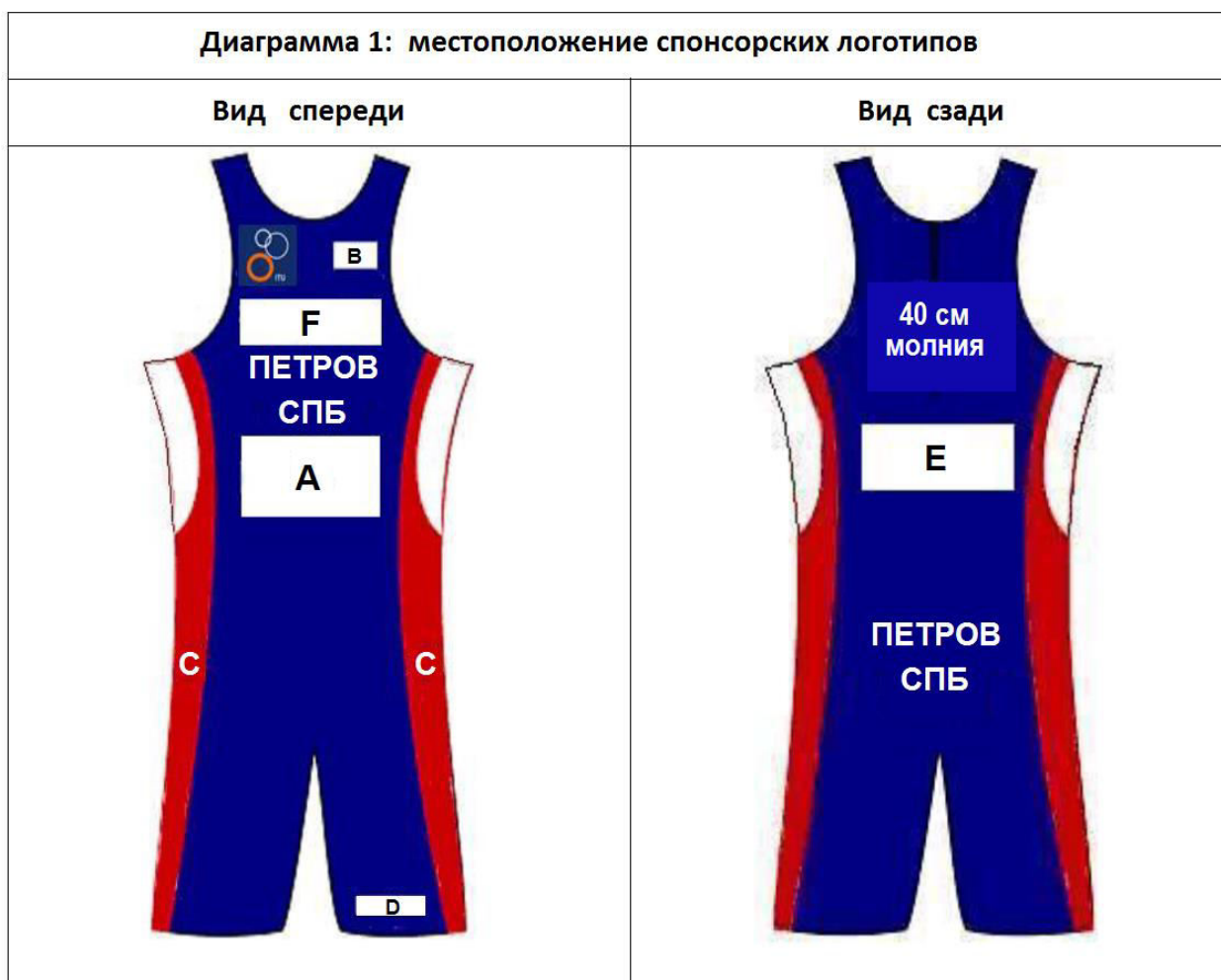
Диаграмма 1: Местоположение мест для спонсора

25.4.1. Стартовая форма должны иметь цвета, выбранные региональной спортивной федерацией для всероссийских соревнований по триатлону,